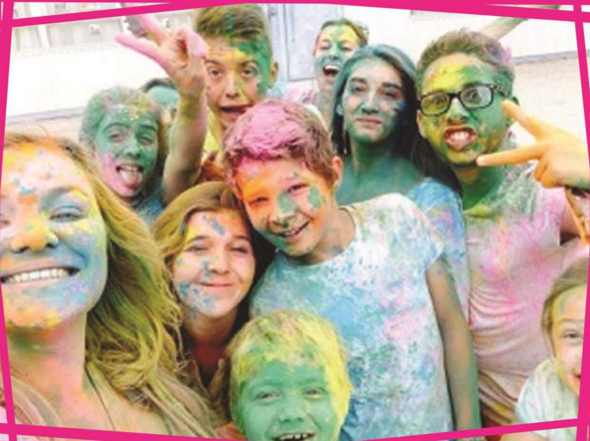
Accueil de Loisirs 2015 - fête des couleurs

Communauté de Communes du Pays de Nérondes