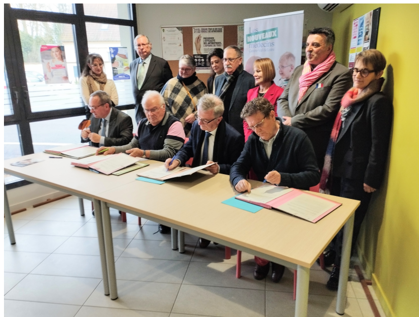
Inauguration Centre de Santé - 20/01/2023

Depuis janvier 2023, deux médecins salariés se sont installés dans les locaux du Centre de santé de Nérondes.