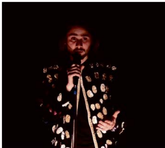
COMÉDIEN. La compagnie Le Grand Douze proposera le spectacle Après les cerises .

Cette pièce de théâtre immersive chante l'amitié et l'esprit de nos campa-