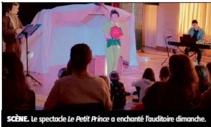
SCÈNE. Le spectacle Le Petit Prince a enchanté l'auditoire dimanche.

Un rendez-vous qui s'est voulu étonnant, détonant, et qui s'est achevé autour du partage du verre de l'amitié, de la dégustation de produits locaux, le tout agrémenté par les échanges entre les comédiens et le public.