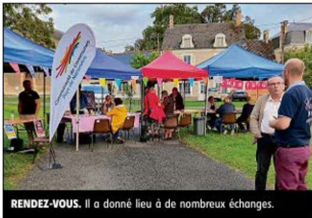
RENDEZ-VOUS. Il a donné lieu à de nombreux échanges.

Le public a pu ainsi déambuler et s'informer